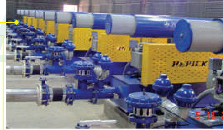
PLANTA FISICO QUIMICA, REGION METROPOLITANA