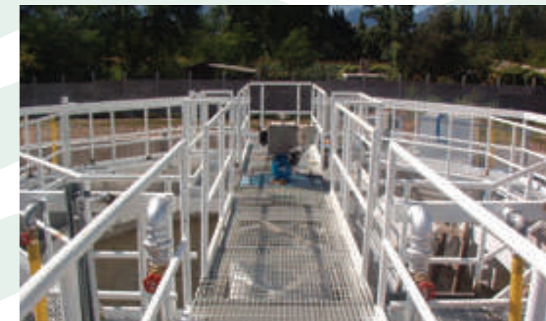
PLANTA COMPACTA DE FIBRA DE VIDRIO, LA LIGUA